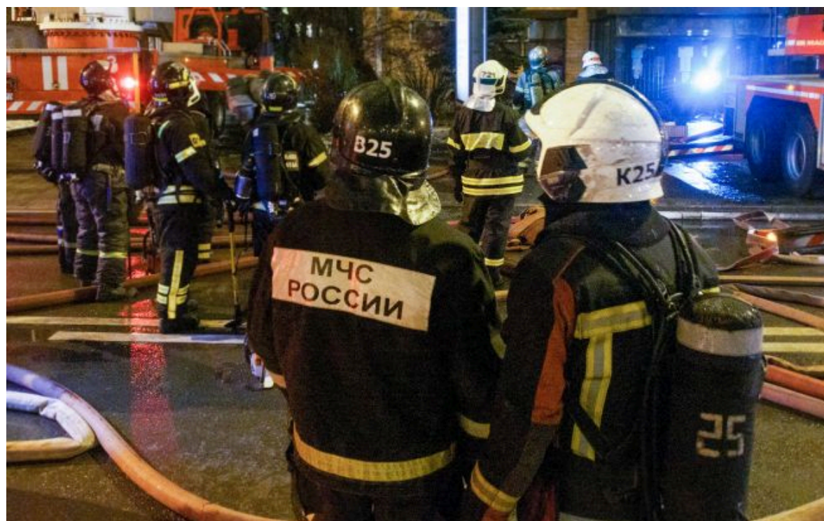
Фото: через атаку перекрили рух місцевою трасою