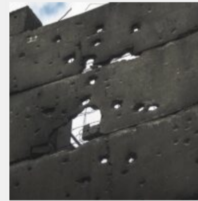
Як виглядає українська ТЕЦ, що пережила не одну ракетну атаку російських загарбників