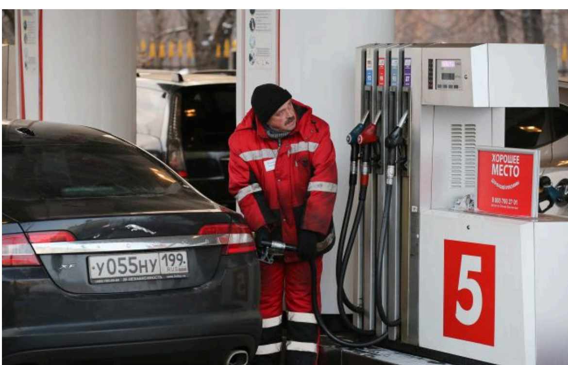
Фото: АЗС у Росії (Getty Images)