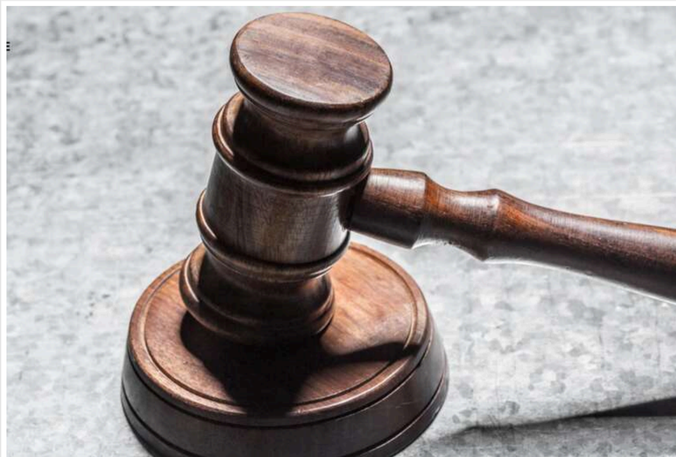
Верховний Суд поставив крапку: ФОП не зміг скасувати штраф у 429 тисяч гривень за «нефіскальні» чеки та відсутність обліку