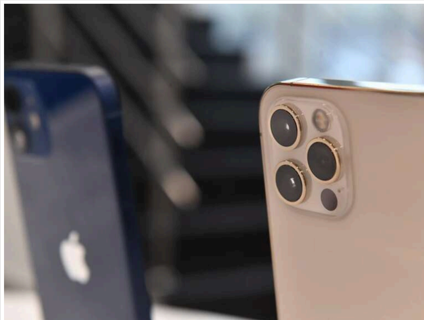
Контрабанда через фейкові адреси: Суд Києва оштрафував та конфіскував смартфони у відправника МПВ

Солом'янський районний суд міста Києва розглянув серію адміністративних справ схеми ввезення техніки в Україну через міжнародні поштові відправлення (МПВ) з використанням неправдивих даних про отримувачів. Однак реальних організаторів схеми виявлено не було.