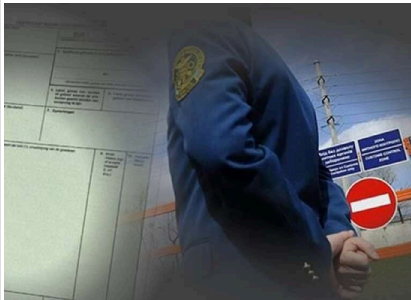
Корупційний конвеєр на митниці: як цифровізація та фальшиві євросертифікати обкрадають держбюджет

Після публікації матеріалу про масштаби корупційні «успіхи» Державної митної служби на адресу ЗМІ поспішали закиди від зацікавлених осіб: «Автор занадто узагальнює».