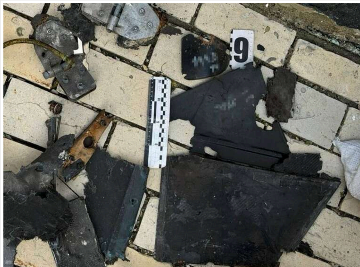
СБУ: Росія атакувала Києво-Печерську лавру дроном «Герань-2», виготовленим на базі іранського Shahed

Служба безпеки України встановила, що Росія вдарила по Києво-Печерській лаврі безпілотним літальним апаратом "Герань-2", що є російською версією іранського дрона-камікадзе типу Shahed.