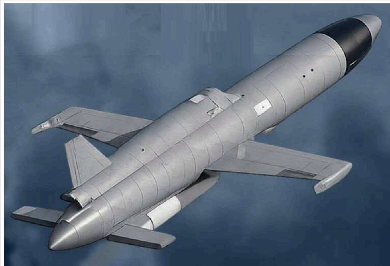
РФ застосувала проти Києва новий баражувальний боєприпас «Бандероль»

Читати на руськом Read in English Додати як бажане джерело в Google