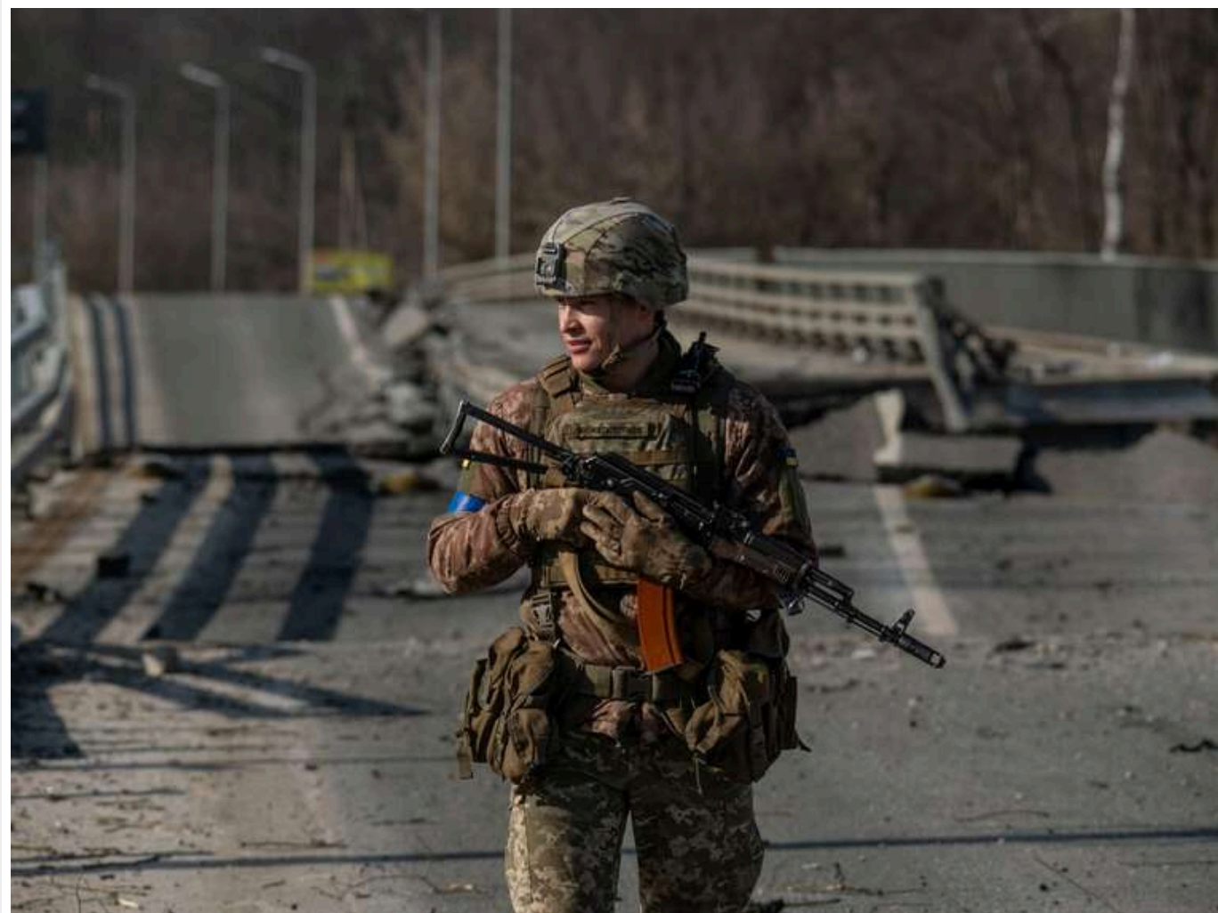
Ситуація на фронті: Зафіксовано 54 боєзткнення, найбільша активність ворога на Лиманському і Гуляйпільському напрямках

Читати на руском Read in English Додати як бажане джерело в Google