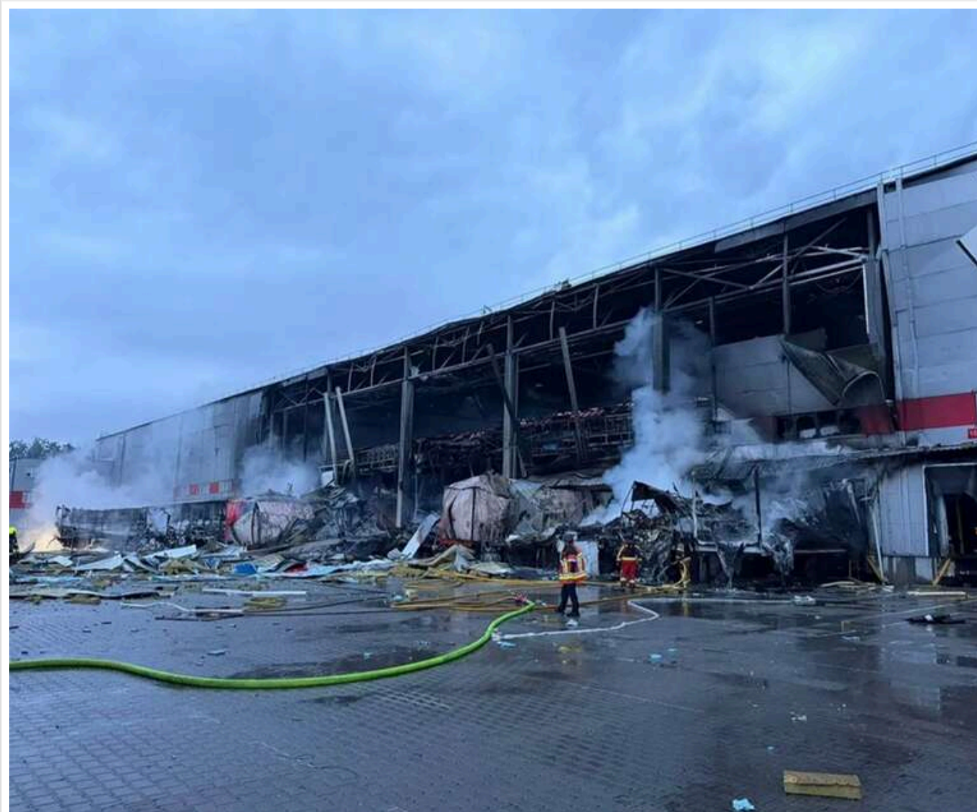
Близько 10 тисяч посилок пошкоджено внаслідок прильоту по терміналу «Нової пошти»

Близько 10 тис. посилок пошкоджено через приліт по терміналу «Нової пошти».