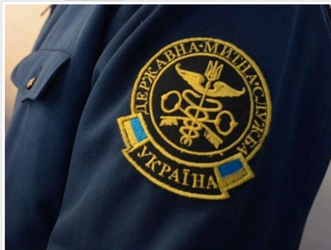
Новий Митний кодекс, євроколії та "єЧерга": як Україна впроваджує європейську модель управління кордонами

Кордон є одним із ключових напрямів реформ, пов'язаних із європейською інтеграцією України.