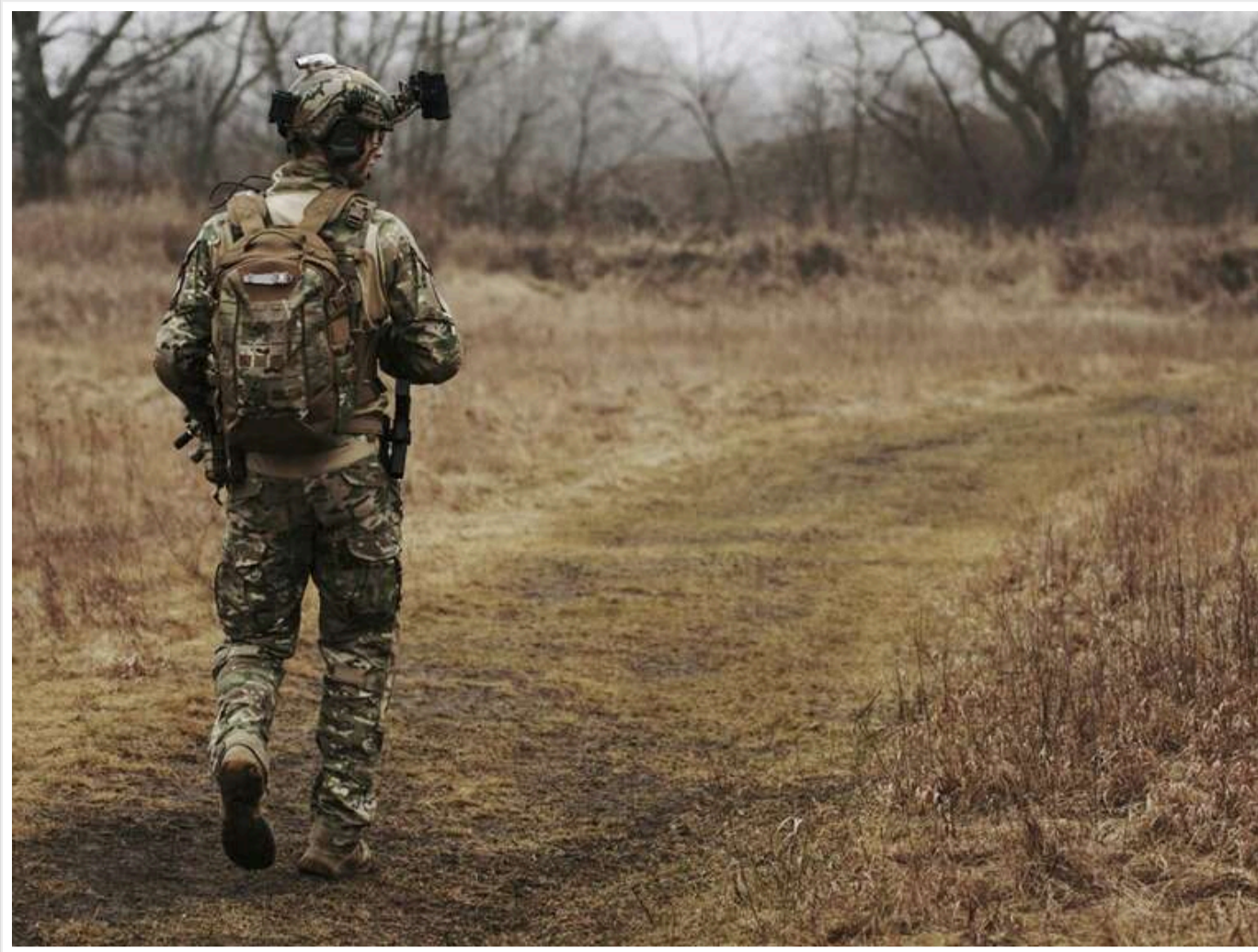
У Раді зареєстровано законопроект щодо пом'якшення покарання за СЗЧ для мобілізованих учасників бойових дій

Статистика СЗЧ в Україні досягла рекордних позначок – понад 255 тисяч проваджень станом на кінець 2025 року.