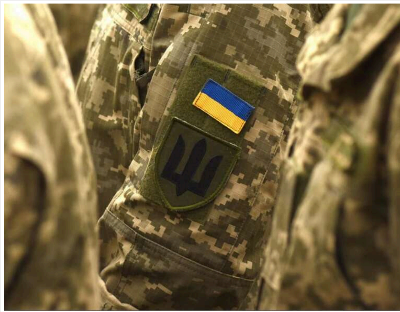
Кабмін затвердив «експериментальну» реформу контрактів у ЗСУ: нові строки служби та виплати

Читати на руськом Read in English Додати як бажане джерело в Google