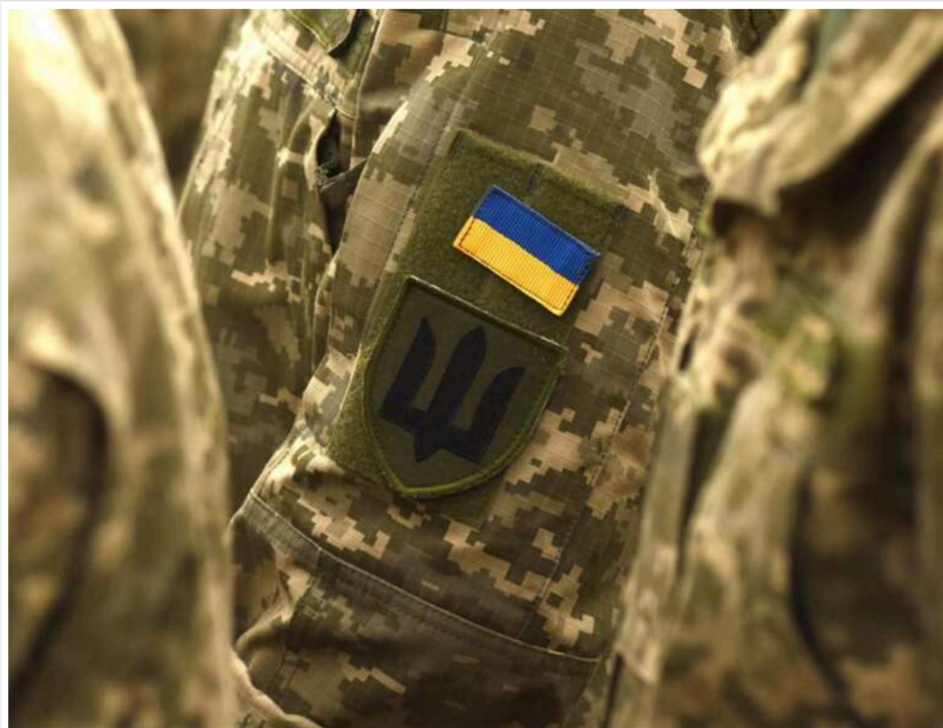
Кабмін затвердив «експериментальну» реформу контрактів у ЗСУ: нові строки служби та виплати