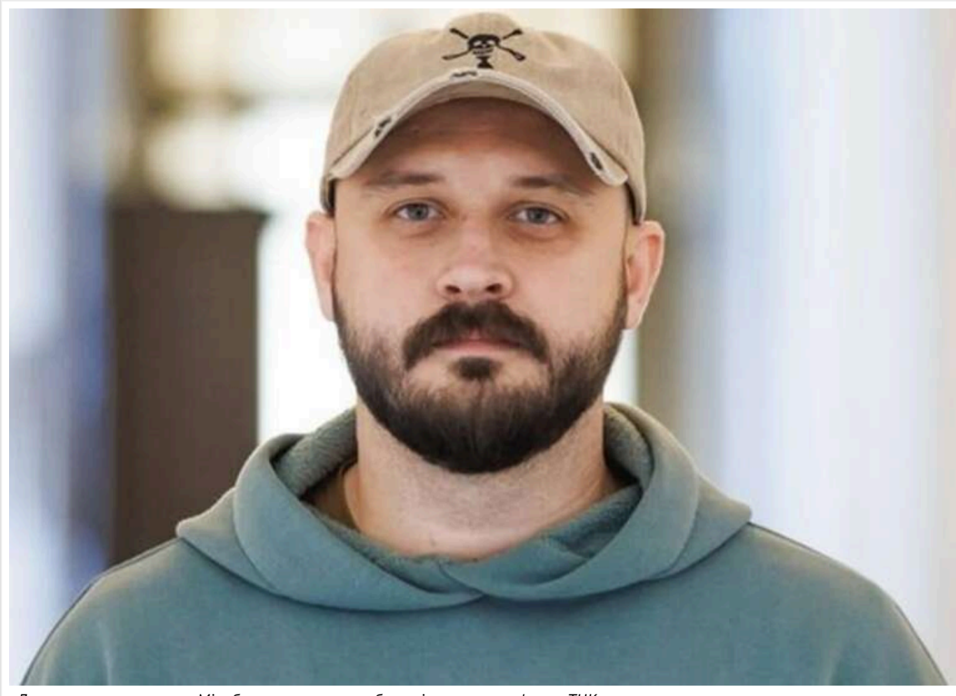
«Дуже погано впливає»: у Міноборони визнали проблему і готують реформу ТЦК

Читати на руском Read in English Додати як бажане джерело в Google