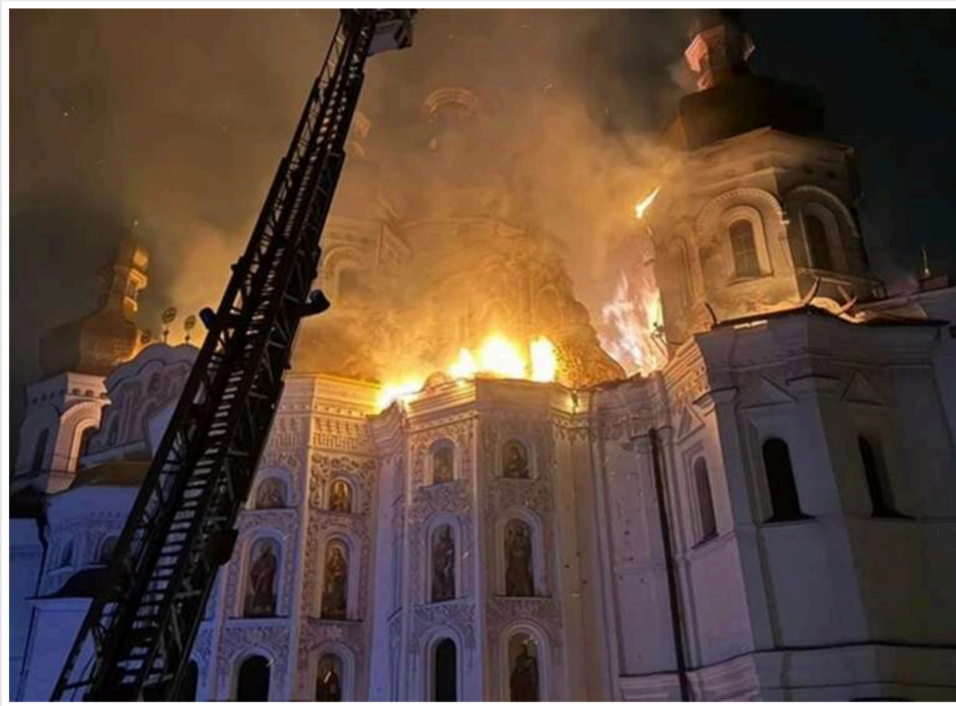
В УПЦ відреагували на удар по Києво-Печерській лаврі і закликали молитися про припинення війни

Після ракетного удару по Києво-Печерській лаврі УПЦ звернулася до віруючих із закликом молитися про якнайшвидше завершення війни.