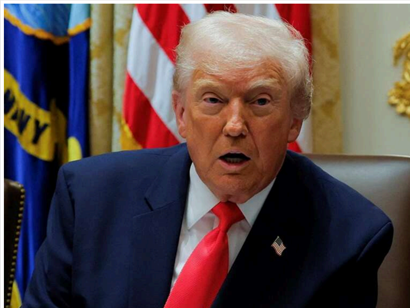
«Обидва лідери відкриті до діалогу»: Трамп зосередився на Україні та оцінив настрої Зеленського та Путіна

Трамп повідомив про готовність України та Росії до переговорів.