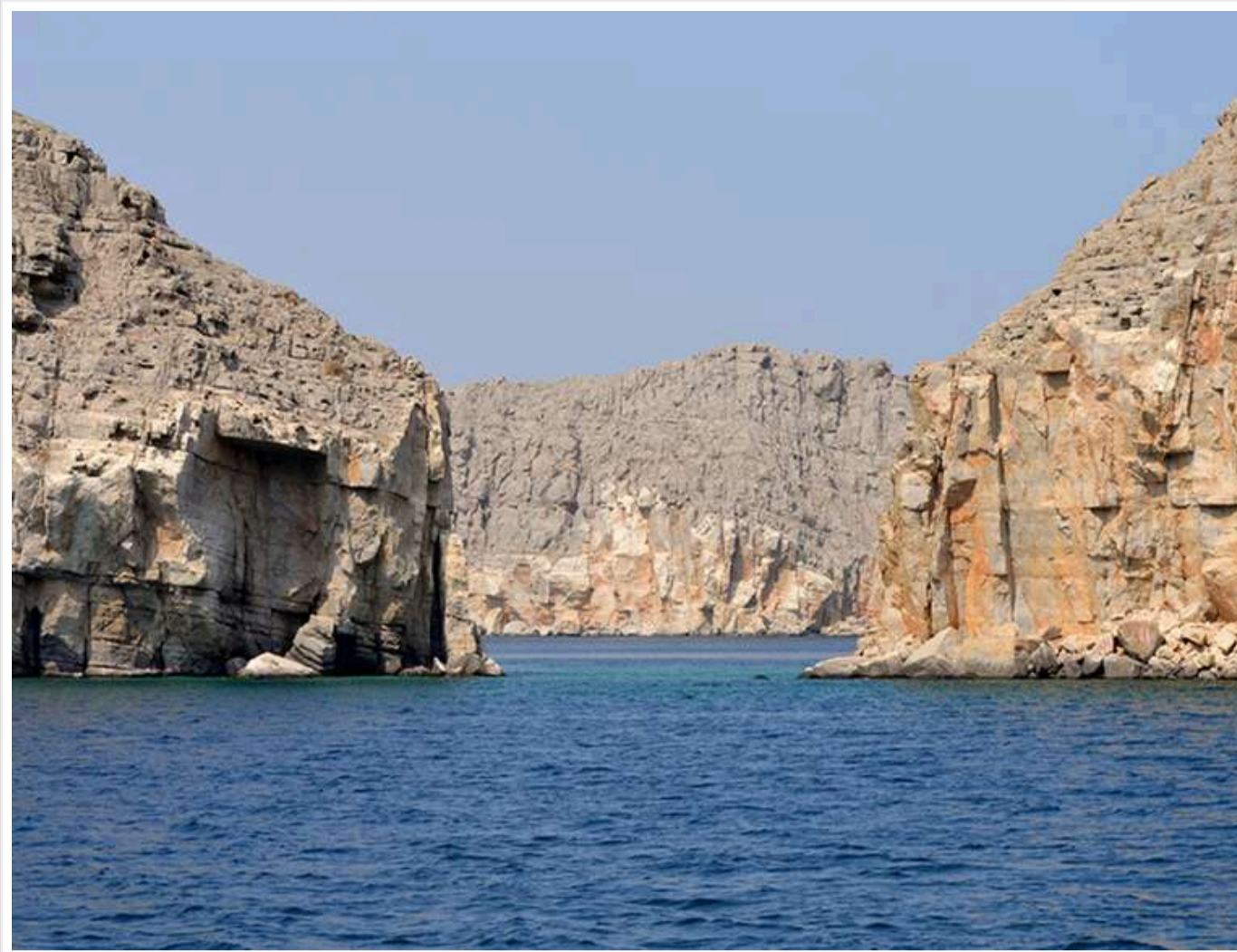
Розмінування Ормузької протоки може зайняти до 50 днів і затримати поставки нафти, - Reuters

За інформацією Reuters, процес розмінування Ормузької протоки може тривати від 40 до 50 днів.