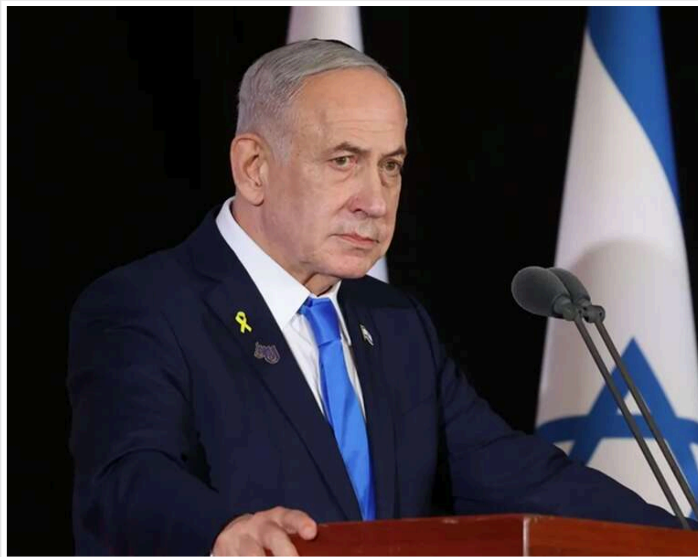
Нетаньягу заперечив, що повалення режиму в Ірані було прямою ціллю операції Ізраїлю

Нетаньягу заперечив, що повалення іранського режиму входило до цілей операції проти Ірану.