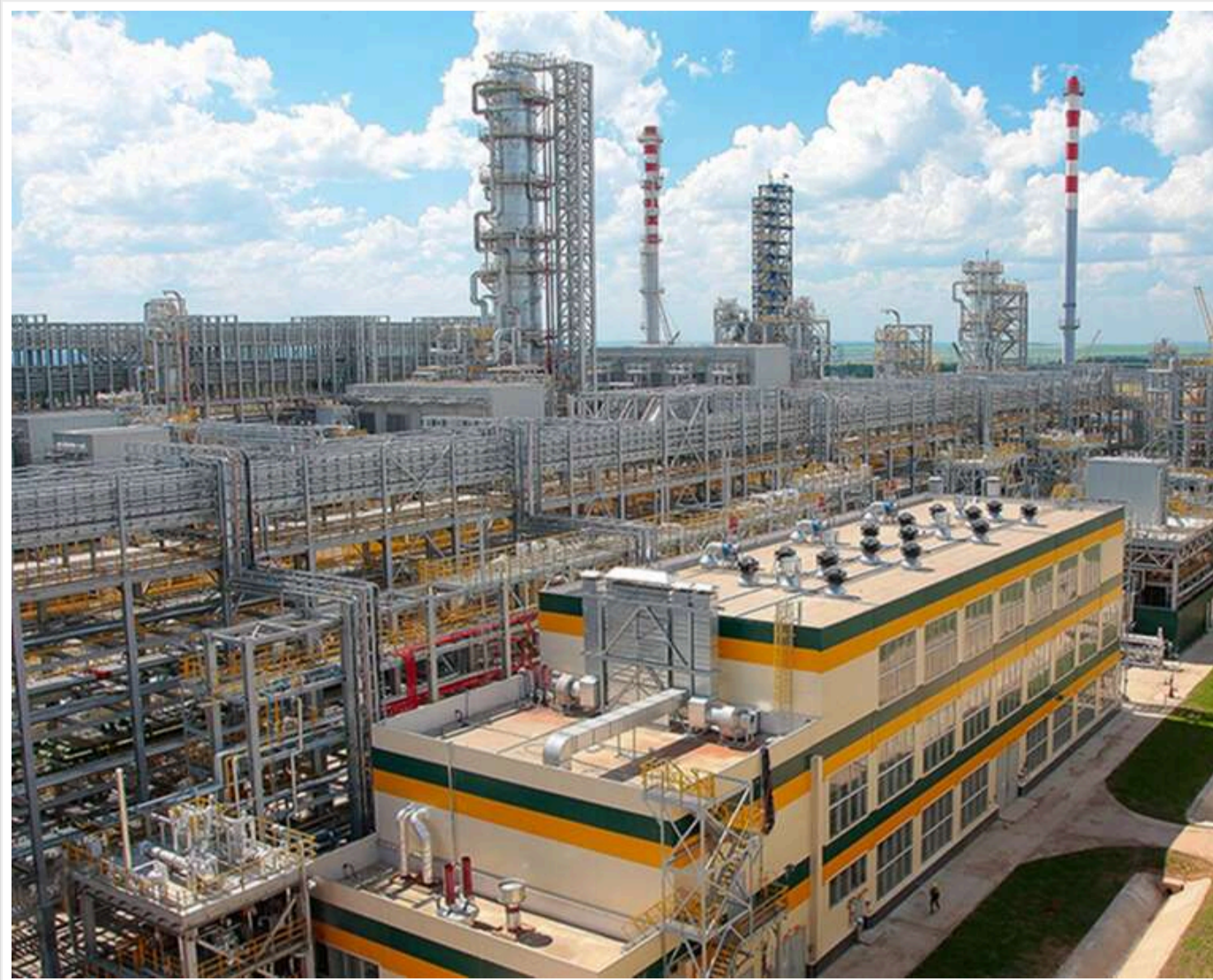
НПЗ «Татнефти» повністю зупинив виробництво після атаки українських дронів, - Reuters

Читати на руськом Додати як бажане джерело в Google