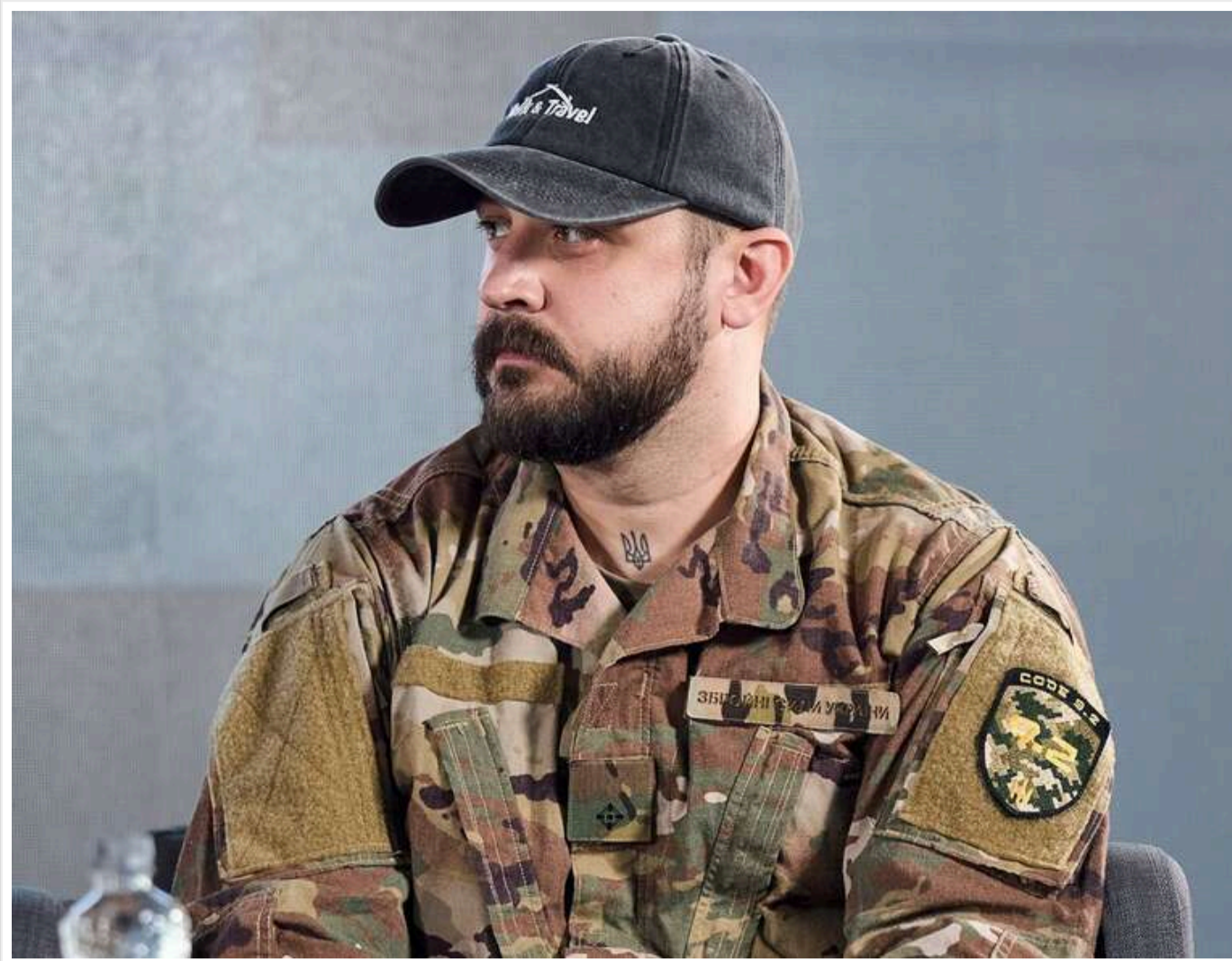
Зарплата в 30 тисяч гривень для військових у тилу зумовлена ресурсами держави, — Міноборони

Заробітна плата у розмірі 30 тисяч гривень для військових у тилу визначена наявними ресурсами держави.