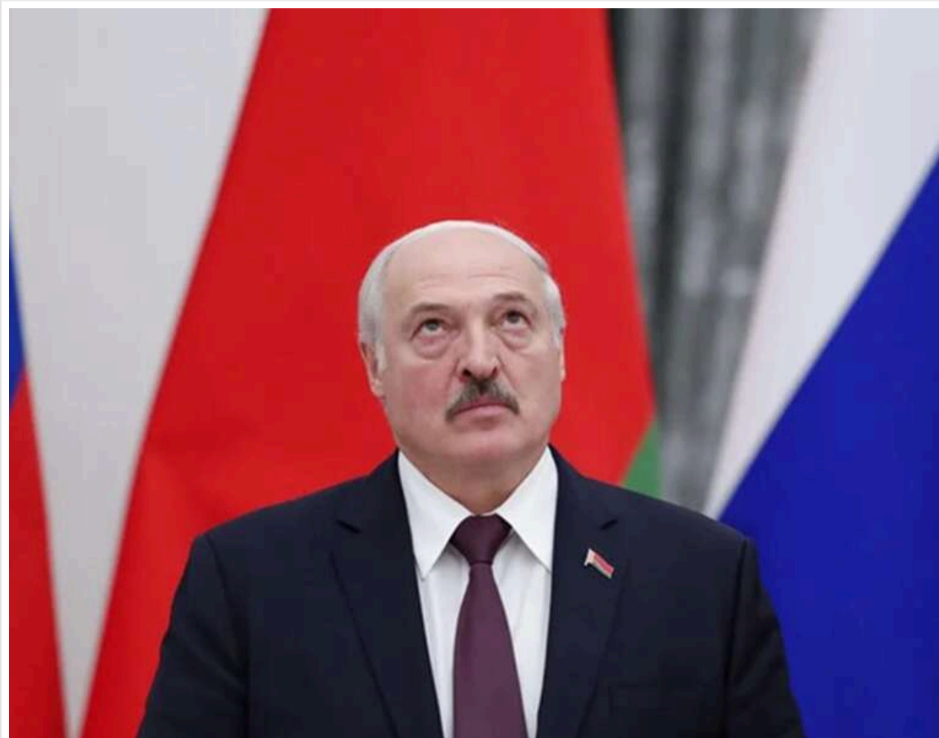
«У Зеленського немає людей»: Лукашенко заявив про відсутність загрози з боку України

«У Зеленського немає людей, щоб загрозувати Білорусі», – Лукашенко.