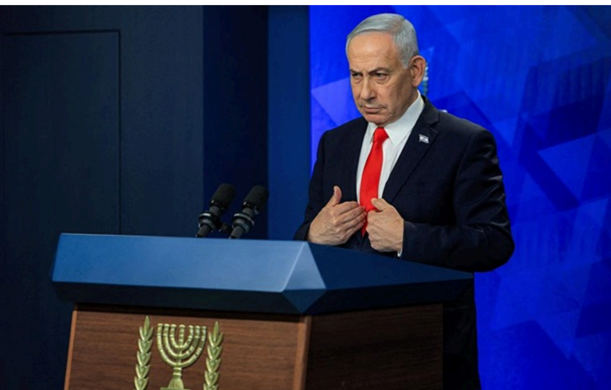
Нетаньягу загалом уникав прямого обговорення угоди

Ізраїль не має наміру виводити війська з південного Лівану, Гази чи Сирії, дав зрозуміти ізраїльський прем'єр.