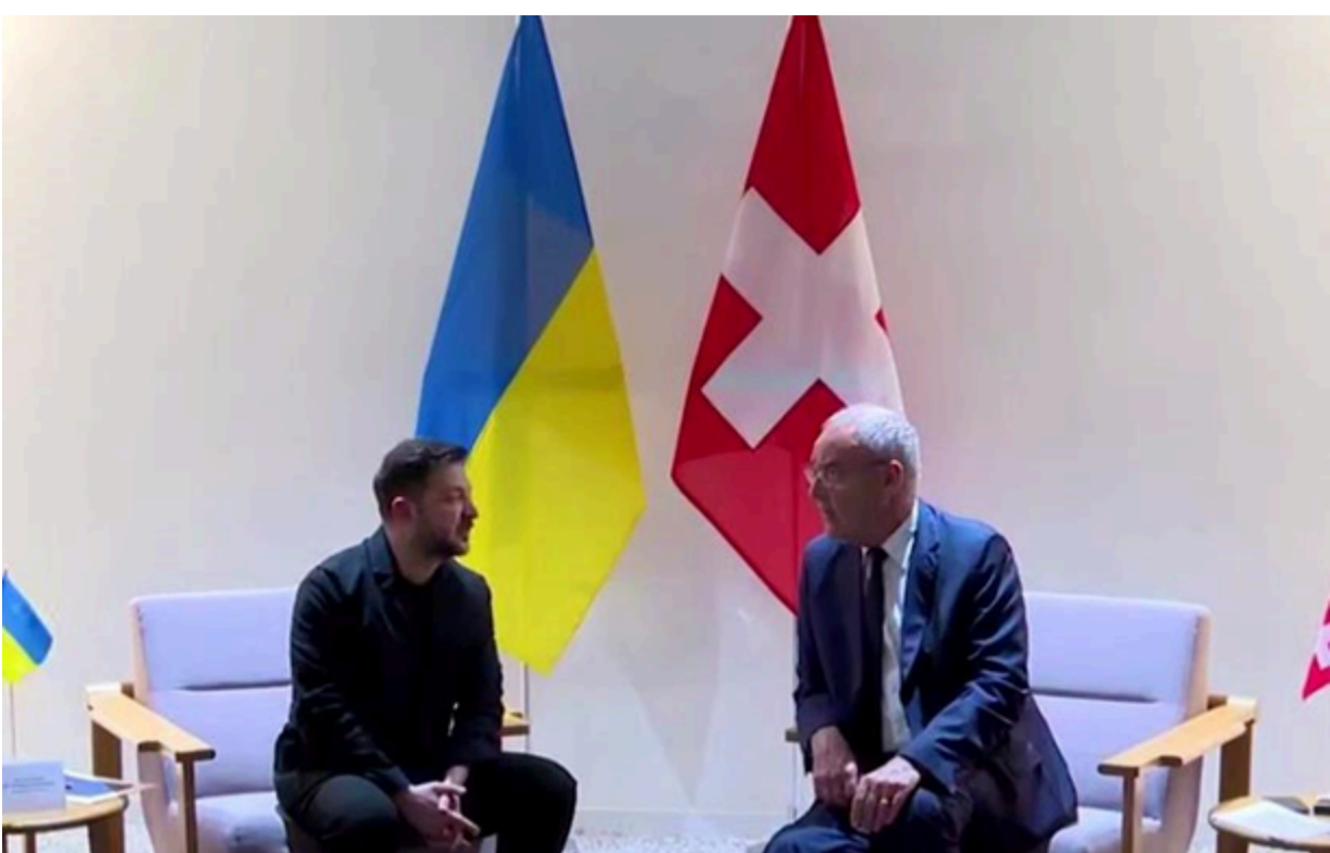
Зеленський поінформував Пармелена про постійні російські атаки та нагальні потреби для захисту України

Лідери України та Швейцарії обговорили співпрацю в енергосфері: Київ надіється "на подальшу підтримку" Берна.