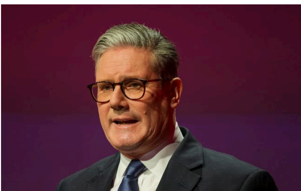
Фото: прем'єр-міністр Великої Британії Кір Стармер

Вимкни хаос міжнародних новин! Отримуй тільки важливе з РБК-Україна у Google