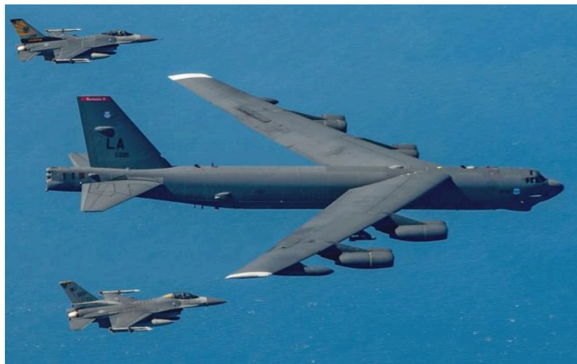
Фото: бомбардувальник B-52 (US Airforce)

Вимкни хаос міжнародних новин! Отримуй тільки важливе з РБК-Україна у Google