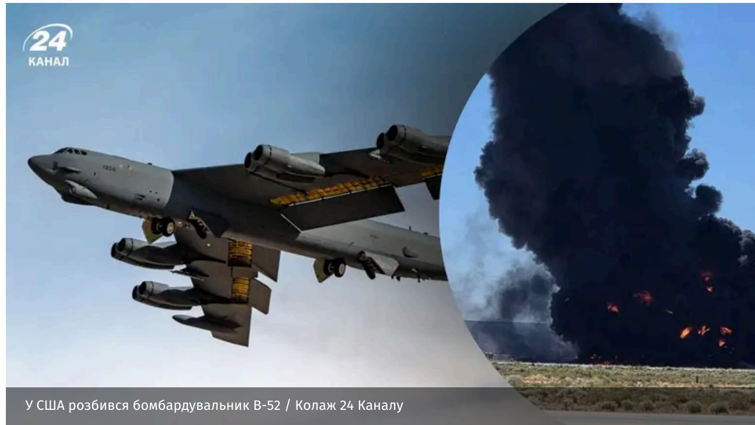
У США розбився бомбардувальник B-52 / Колаж 24 Каналу

Вранці 15 червня у США розбився стратегічний бомбардувальник B-52 Stratofortress. Аварія трапилась невдовзі після зльоту з авіабази Едвардс.