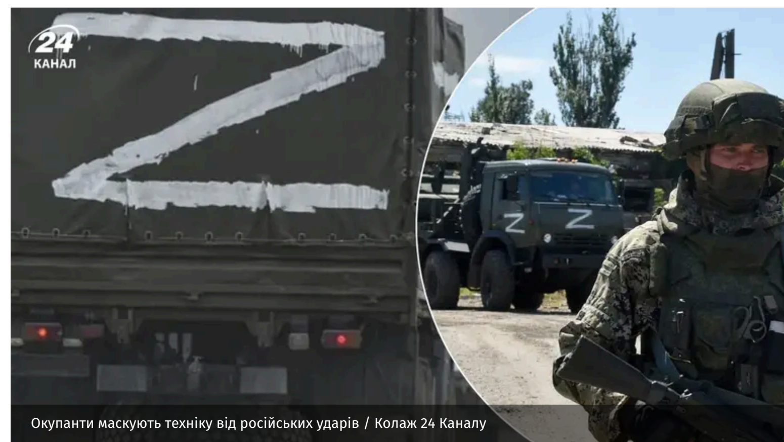
Окупанти маскують техніку від російських ударів

У районі Генічеська російські війська масово перефарбовують військову автотехніку в кольори, схожі на цивільні. Так окупанти намагаються маскувати техніку та ускладнити її ідентифікації.