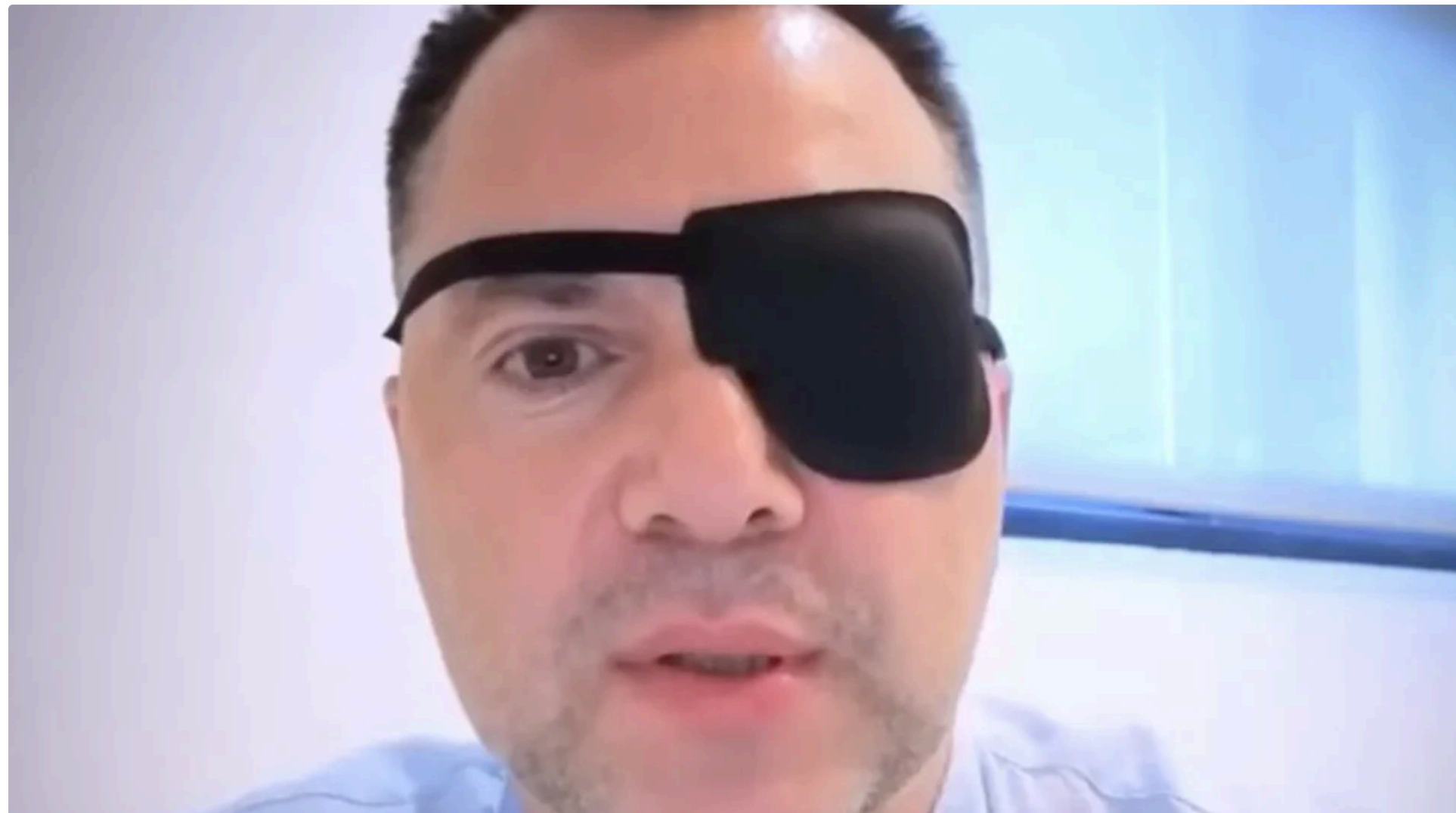
Арестович вийшов у мережу, приховавши одне око

Колишній радник Офісу президента України, підсанкційний блогер Олексій Арестович шокував користувачів Instagram своїм виглядом під час прямого ефіру, який він провів 15 червня .