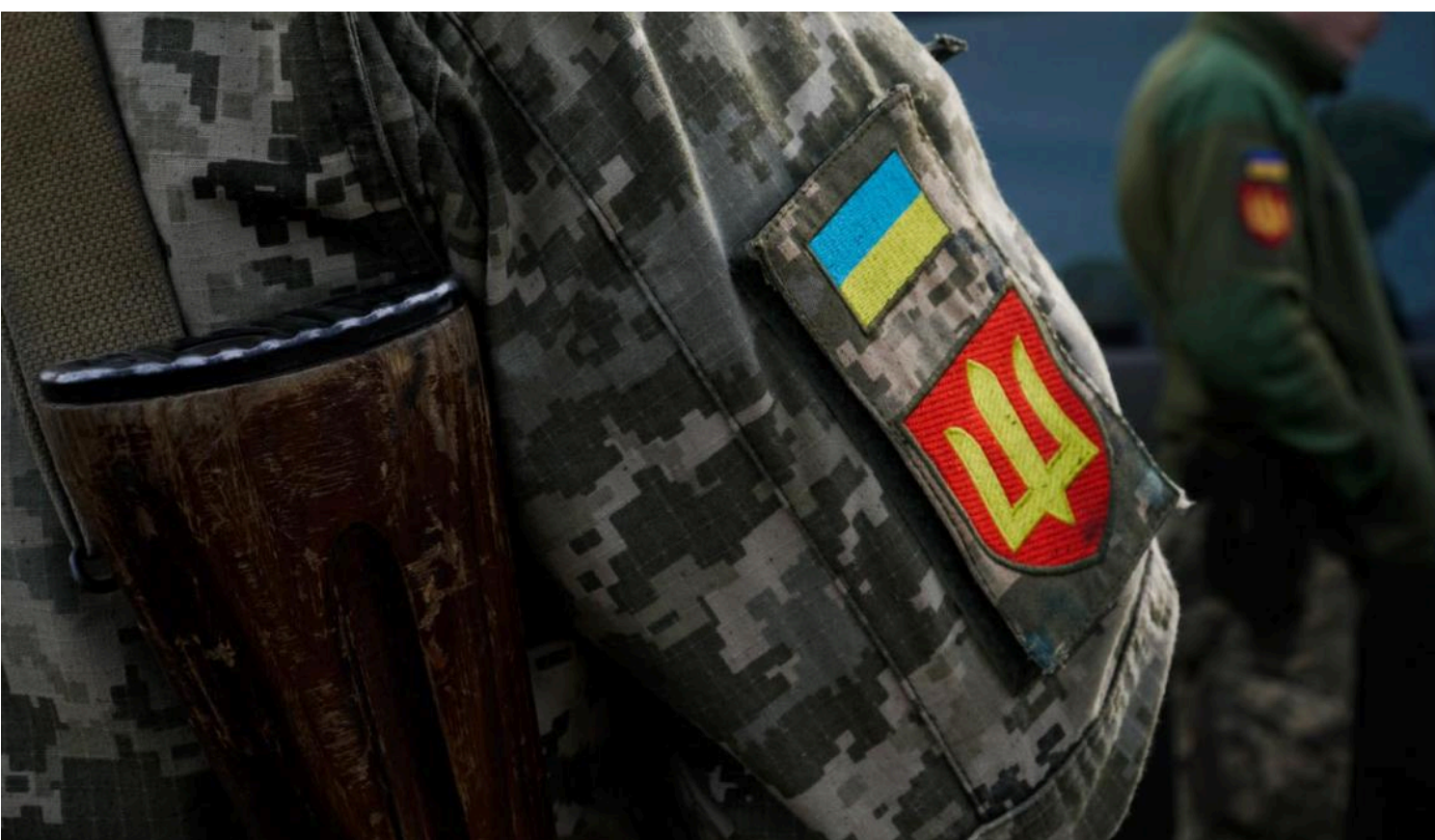
У Міноборони назвали перші результати спрощеного повернення із СЗЧ

У відомстві кажуть, що очікують на повернення із СЗЧ тисяч людей.