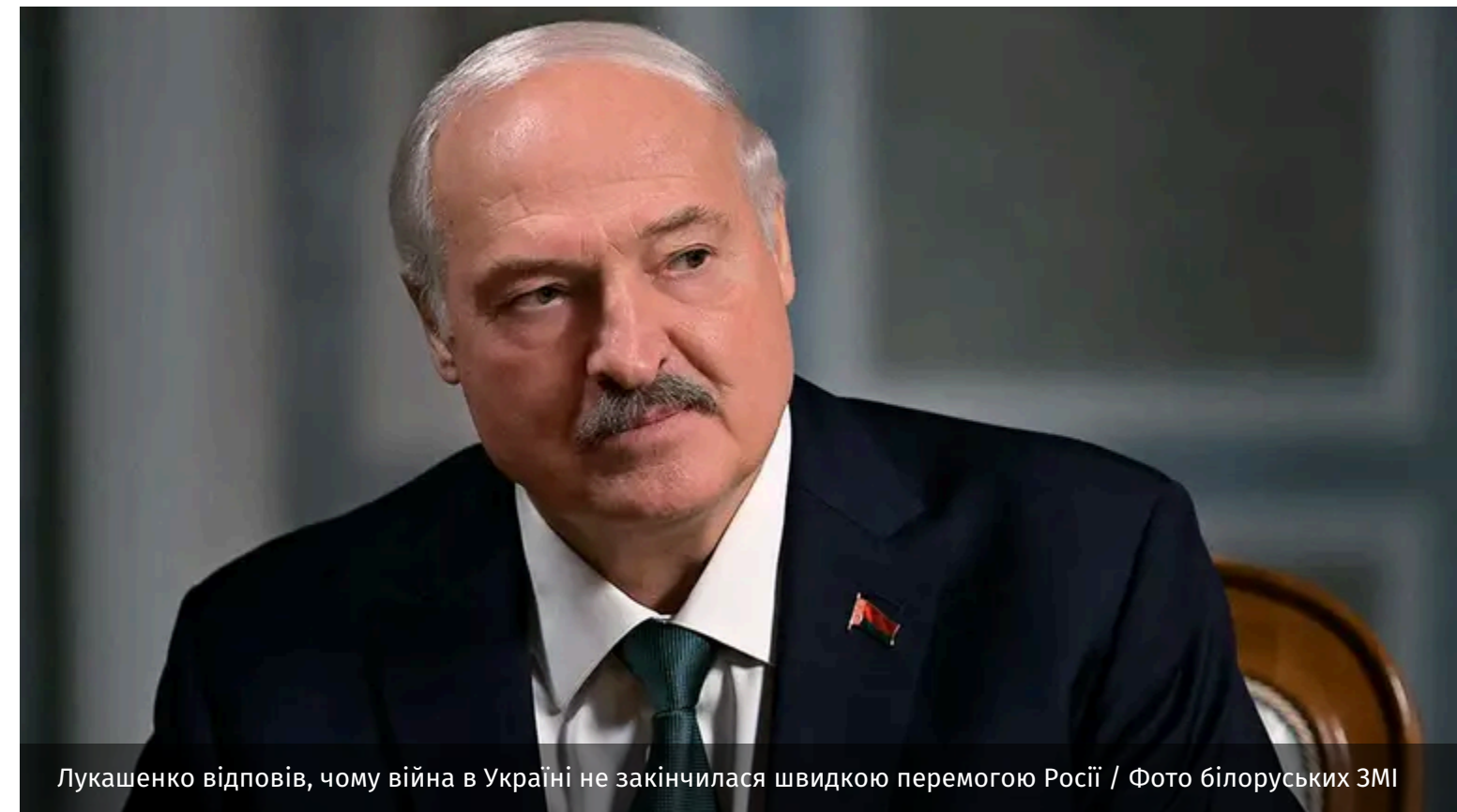
Лукашенко відповів, чому війна в Україні не закінчилася швидкою перемогою Росії

Олександр Лукашенко цинічно пояснив причину, чому "конфлікт в Україні" не завершився "швидкою перемогою Росії". Самопроголошений лідер Білорусі заявив, що російського президента Володимира Путіна нібито обдурили.