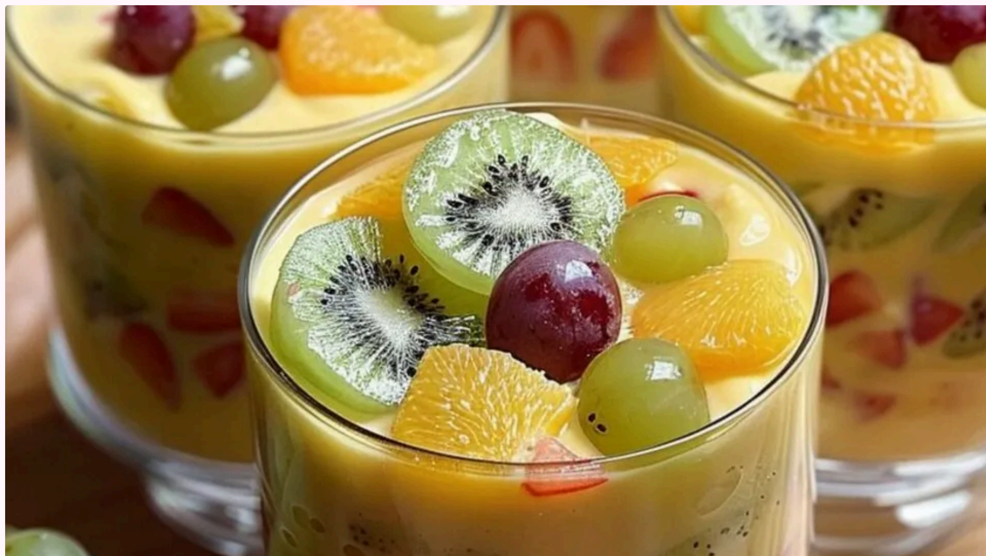
Найкраще використовувати тверді фрукти, які не виділяють забагато соку

Цей фруктово-ягідний десерт у склянках завжди має яскравий вигляд і щоразу швидко зникає зі столу. Редакція інтернет-видання "ГОРДОН" радить саме в червні приготувати такий ніжний вершковий пудинг зі шматочками соковитих фруктів і ягід.