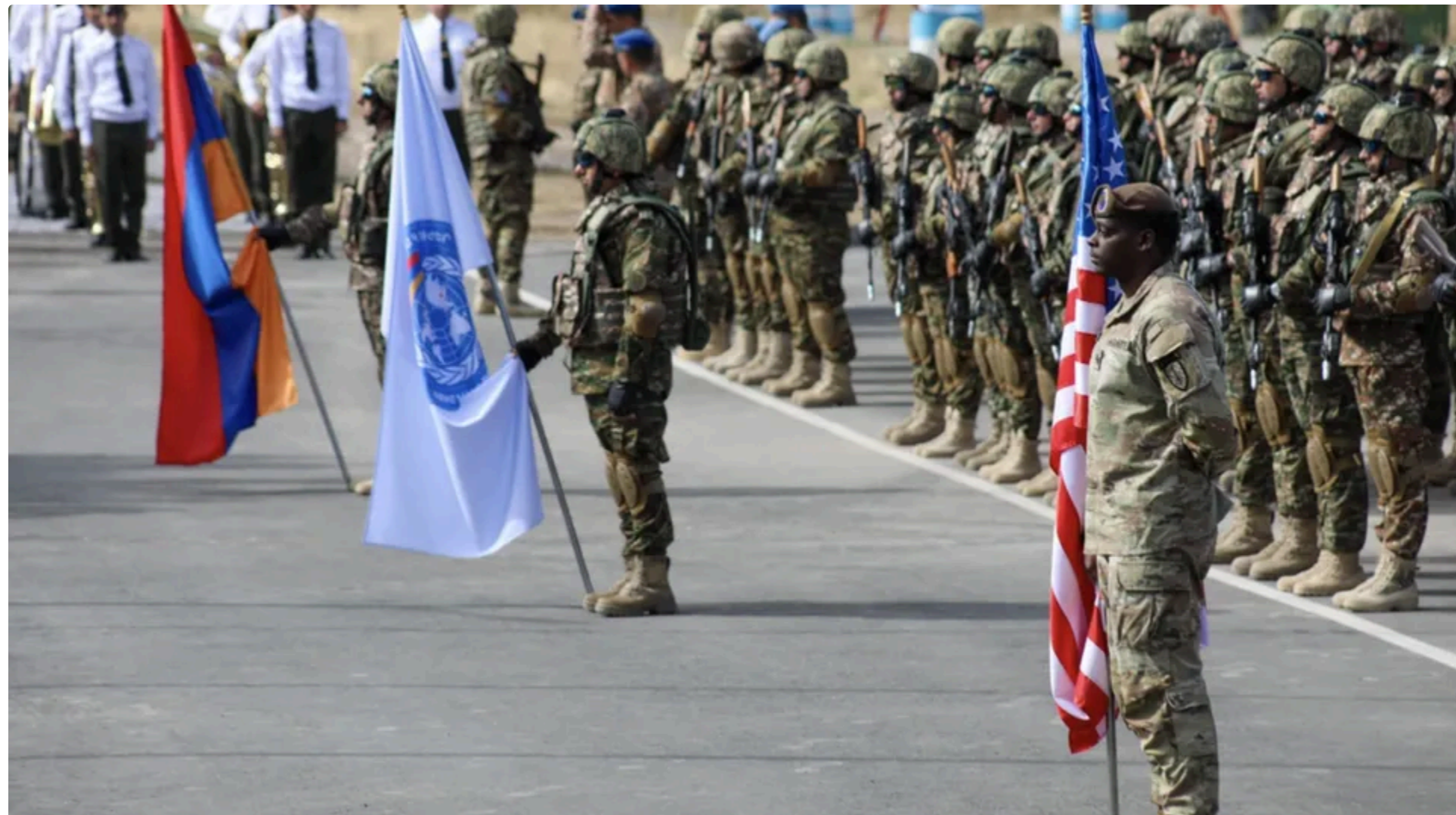
Цьогоріч навчання вперше проведуть у новому форматі

15 червня, 22.32 🗨️ Этот материал также можно прочитать на русском