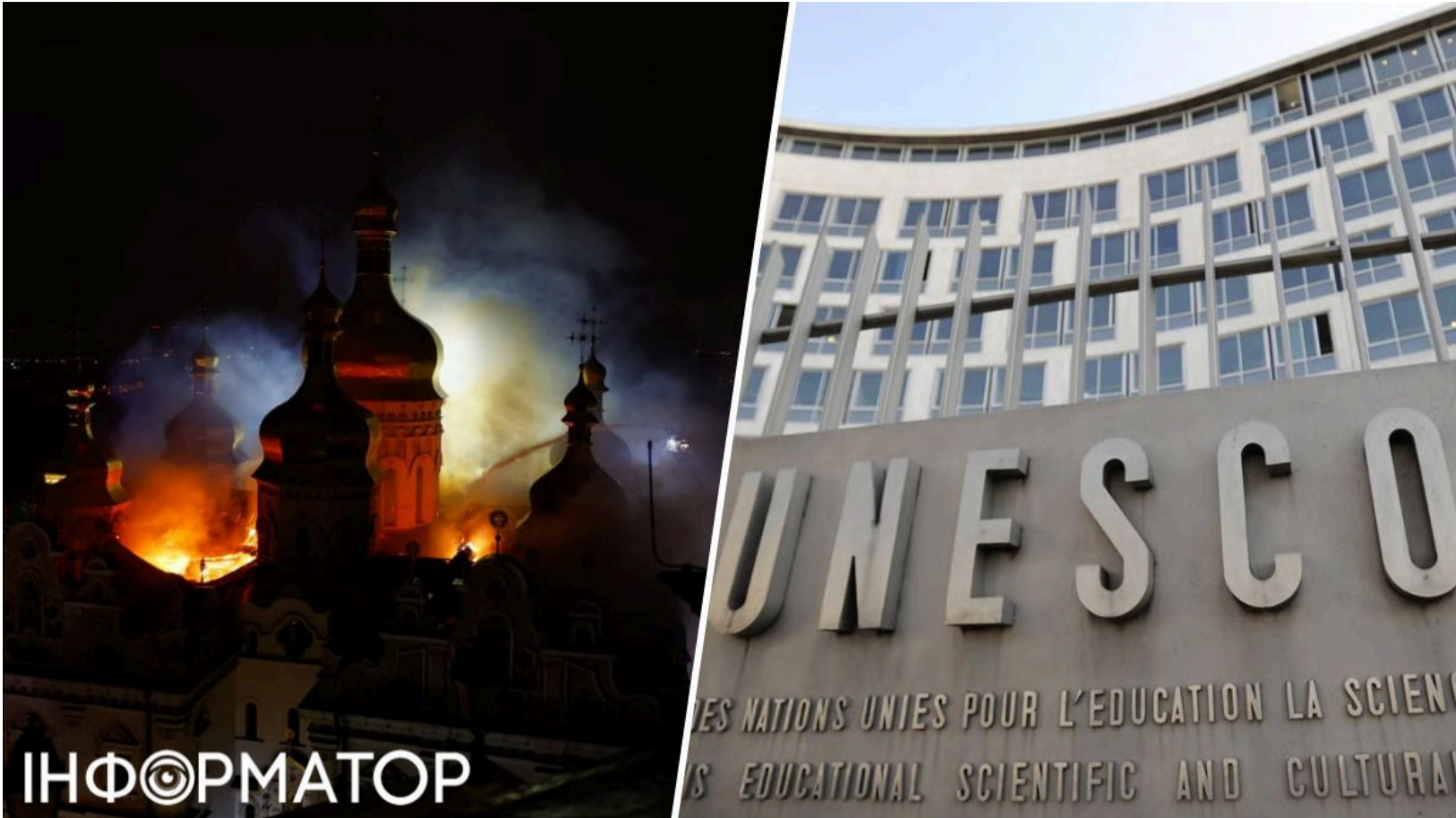
ЮНЕСКО засудило удар Росії по Лаврі

Організація Об'єднаних Націй з питань освіти, науки і культури засудила російський удар по Києво-Печерській лаврі, завданий у ніч на 15 червня. Зеленський назвав атаку найбільшим злочином проти християнської культури . Заява ЮНЕСКО з'явилася цього ж дня, однак реакція організації виглядає запізнілою та надто стриманою для злочину проти об'єкта всесвітньої спадщини. Удар пошкодив одну з найбільш значущих духовних і культурних пам'яток України.