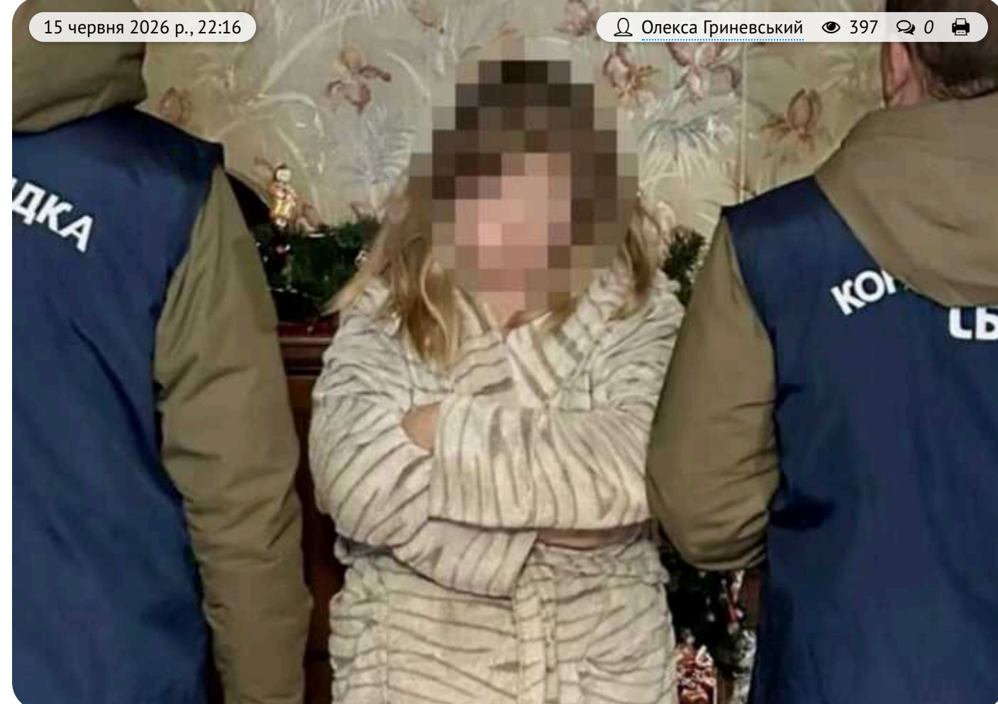
У Харкові судитимуть викладачку за збір розвідінформації для спецслужб РФ

У Харкові перед судом постане старша викладачка англійської мови одного з харківських університетів. За даними слідства, вона збирала розвідінформацію для російських спецслужб.