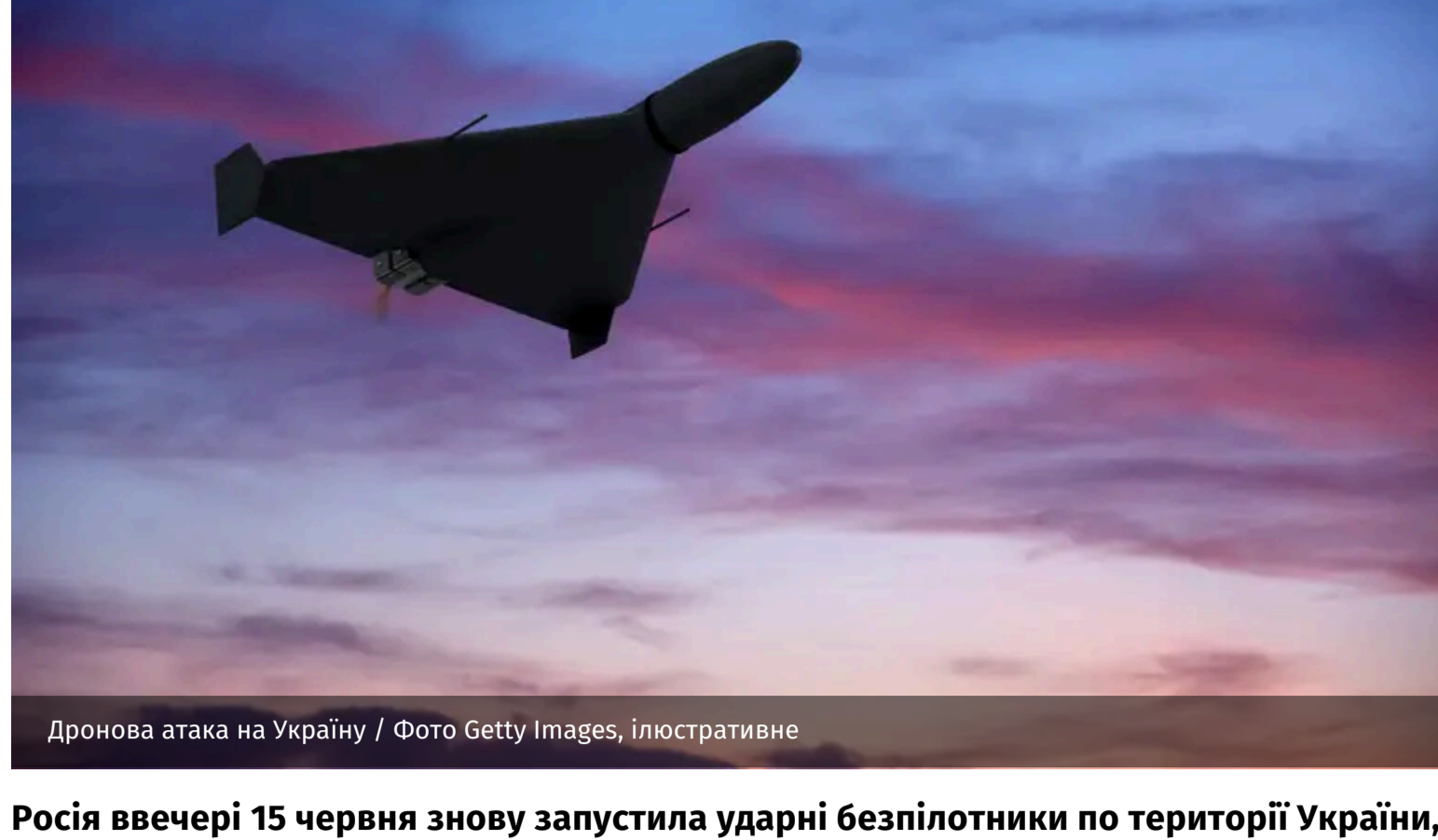
Дронова атака на Україну / Фото Getty Images, ілюстрацієне

Росія ввечері 15 червня знову запустила ударні безпілотники по території України, атакуючи міста та села. Через це у частині областей оголосили повітряну тривогу.