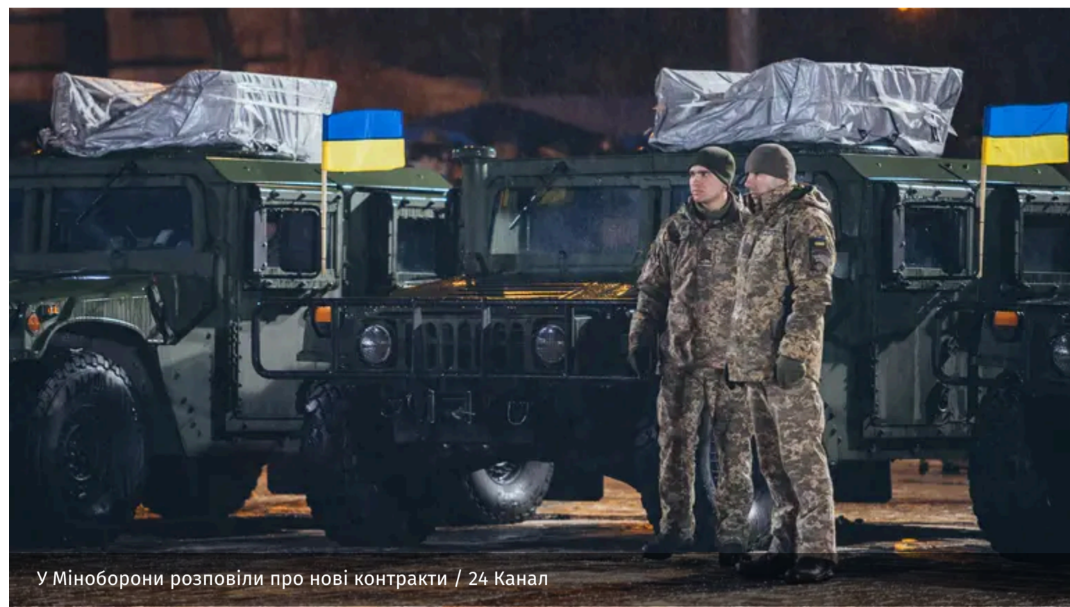
У Міноборони розповіли про нові контракти

У Міноборони розповіли про перші етапи трансформації ЗСУ. Заступник міністра оборони Мстислав Банік заявив, що військові, які відмовляться підписувати нові контракти, продовжуватимуть службу до демобілізації.