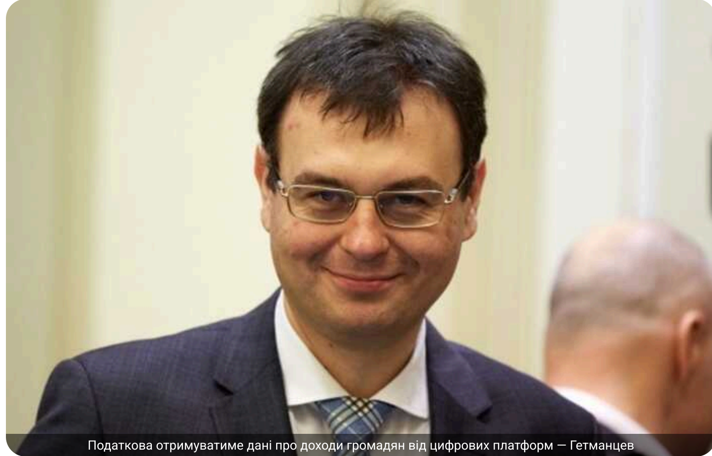
Податкова отримуватиме дані про доходи громадян від цифрових платформ — Гетманцев

Податкові органи отримуватимуть дані про доходи громадян безпосередньо від цифрових платформ і надсилатимуть повідомлення про необхідність сплати податків.