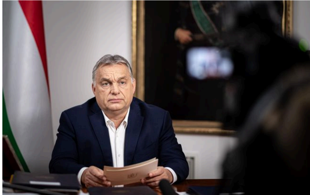
Фото: Віктор Орбан, прем'єр Угорщини

Не витрачай час на шум! Читай тільки суть з РБК-Україна у Google