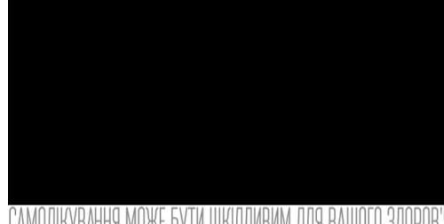
Якщо з'явилися варикозні вени або синюшні вузли, застосуйте це