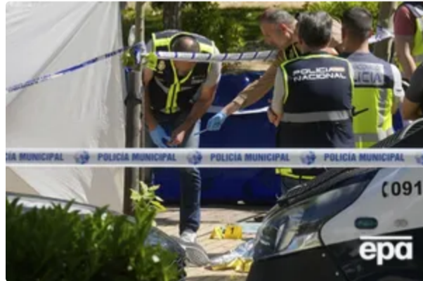
Підозрюваний у вбивстві Портнова – українець – ЗМІ