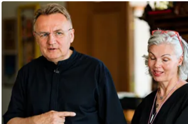
Сини мера Львова – за кордоном. Яке запитання про дітей розратувало дружину Садового. Відео