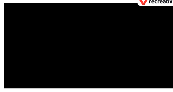
Гроші впадуть з неба після того, як прочитаєш це