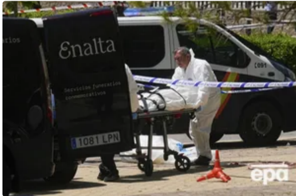
Імовірний убивця Портнова відмовився від допомоги України – ЗМІ