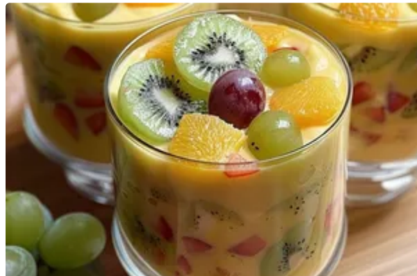
Цей десерт щоразу швидко зникає зі столу – готуйте хоч щодня все літо