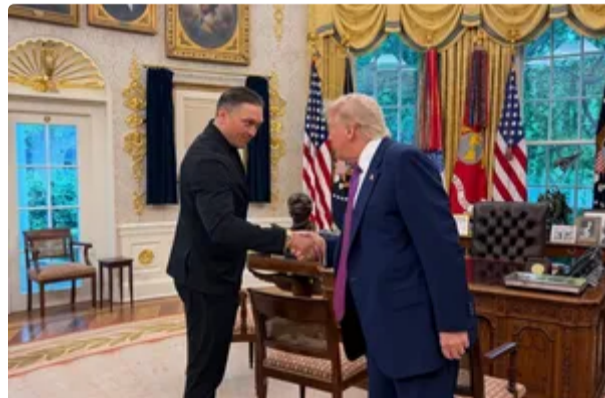
Усик розповів подробиці своєї зустрічі з Трампом в Овальному кабінеті. Фото