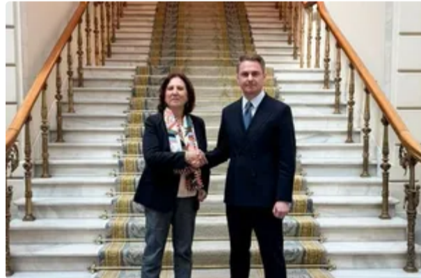
Україна переконала Іспанію разом розслідувати вбивство Портнова