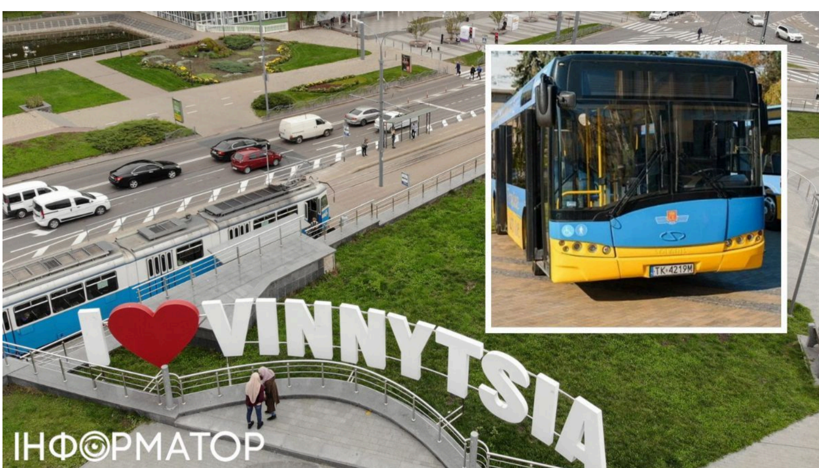
Поляки зібрали пів мільйона злотих для Вінниці

Польський благодійний фонд зібрав понад пів мільйона злотих, щоб самостійно купити списані автобуси та передати їх Вінниці. Лише за чотири дні поляки зібрали потрібну суму - збір під гаслом "Політики блокують, а ми їдемо далі" підтримали понад 6 тисяч небайдужих громадян. Це стало реакцією на гучний скандал , через який Вінниця змушена була відкликати власне прохання про допомогу.