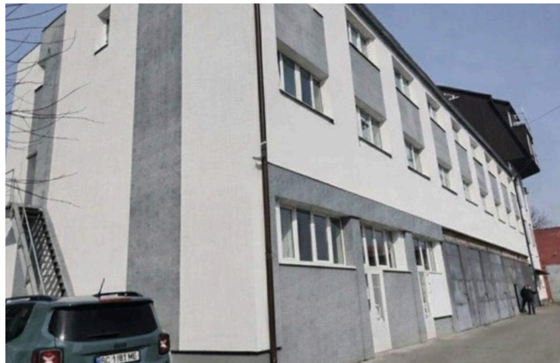
У центрі Львова змінився власник відомої адміністративної будівлі