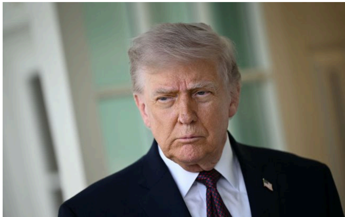
Фото: Дональд Трамп, президент США (Getty Images)