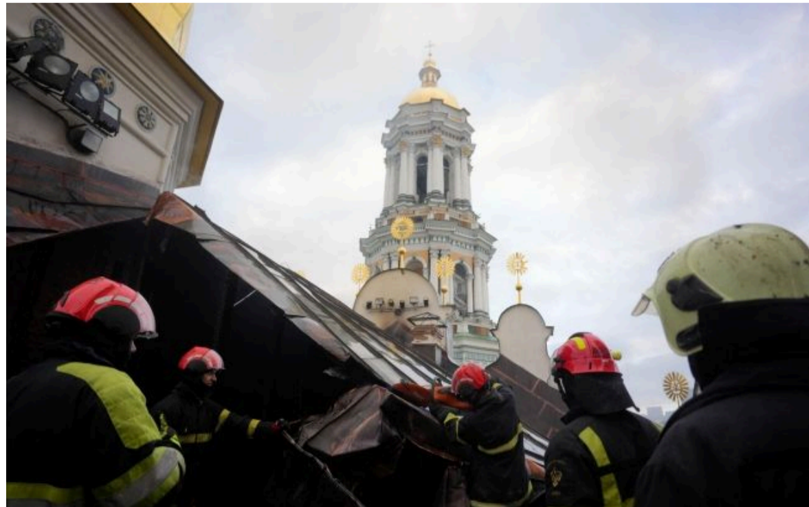
Фото: наслідки удару по Києво-Печерській лаврі (t.me/dsns_kyiv)