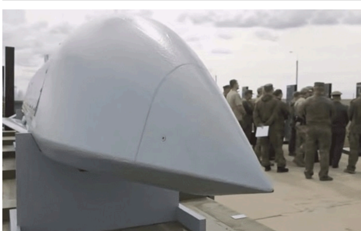
Бармакуючий боеприпас Бандероль

Противник знову застосував баражуювальні боеприпаси Бандероль під час масованої повітряної атаки.