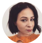
Автор Тетяна Краєвська