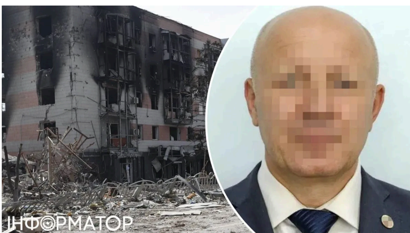
Колаборант допоміг відібрати квартири маріупольців

Колишній український поліцейський, який після початку повномасштабного вторгнення перейшов на бік окупантів, отримав нову підозру - він допоміг незаконно вилучити щонайменше 3 790 квартир і будинків маріупольців. Схожий метод тиску на цивільних окупанти застосовують і в інших сферах - залучаючи зрадників, які мають доступ до ресурсів або систем. Наразі підозрюваний перебуває у розшуку.