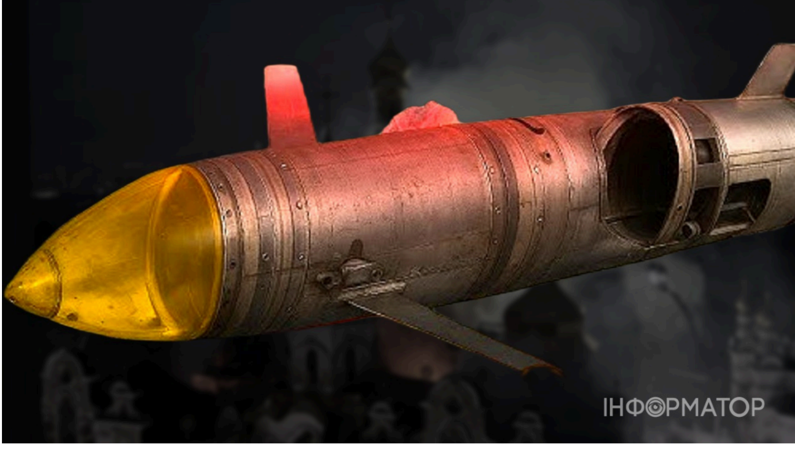
Росія вперше вдарила "Бандеролями" по Україні

Росія вперше масово застосувала реактивний ударний безпілотно́к нового покоління "Бандероль" під час нічної атаки на Україну 15 червня . Попередні масовані удари по Києву також завдавали серйозних втрат серед цивільного населення, однак нинішня ніч відзначилася безпрецедентним різноманіттям застосованих типів зброї. "Бандеролі" рухалися на Чернігівщину, Київщину та Житомирщину - і саме вони стали головною новинкою цієї атаки.