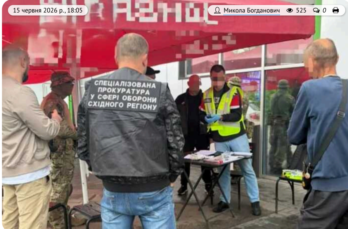
На Харківщині викрили схему незаконного виїзду військовозобов'язаного через фіктивний шлюб

У Харківській області викрили ймовірну схему торгівлі людьми та незаконного переправлення чоловіка призовного віку через державний кордон. За версією слідства, для виїзду військовозобов'язаного з України підозрювані організували фіктивний шлюб із 27-річною жінкою з інвалідністю II групи.