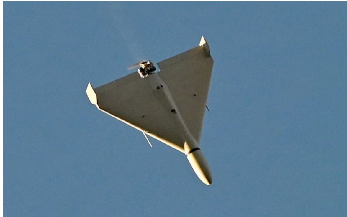
Фото: російський дрон-камікадзе типу "Шахед"

Розумій ситуацію на фронті через факти, а не чутки з РБК-Україна у Google